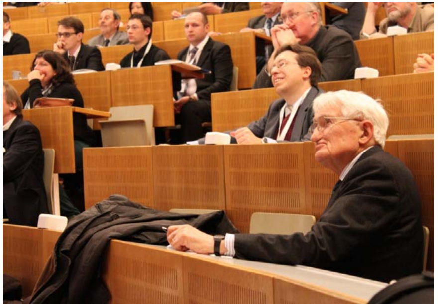
(Jürgen Habermas, Teilnehmer und Diskutant beim Kongress „Rethinking Europe“)